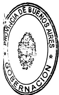
Ing. FELIPE SOLÁ GOBERNADOR DE LA PROVINCIA DE BUENOS AIRES